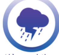
Aide aux victimes de catastrophe