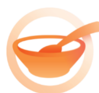
Lutte contre la faim